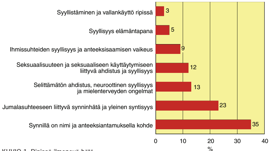
KUVIO 1. Ripissä ilmenevä häjä

Paljon ongelmallisempi oli tilanne silloin, kun ihmisen häjä oli selittämätöntä ahdistusta, neuroottista syylisyyttä tai mielenterveyden ongelmia (13 %), seksuaalisuuteen (12 %) tai ihmisuhteisiin (9 %) liittyvää syylisyyttä tai jos hänelle oli muotoutunut tavaksi tarkastella ylipäänsä elämää syylisyydestä käsin (5 %). Absoluution käyttö auttamisvälineenä oli hyvin ongelmallinen myös silloin, kun ripittäytyjä oli itse joutunut vallankäytön – esimerkiksi alistetuksi tulemisen tai inestien – uhriksi (3 %). Näissä tapauksissa synninpäästö ei välttämättä toiminnut ollenkaan ihmistä auttavasti, vaan päinvastoin se saattoi sitoa ihmisen hänen syylisyyteensä. (Kettunen 1998, 265, 290–385)